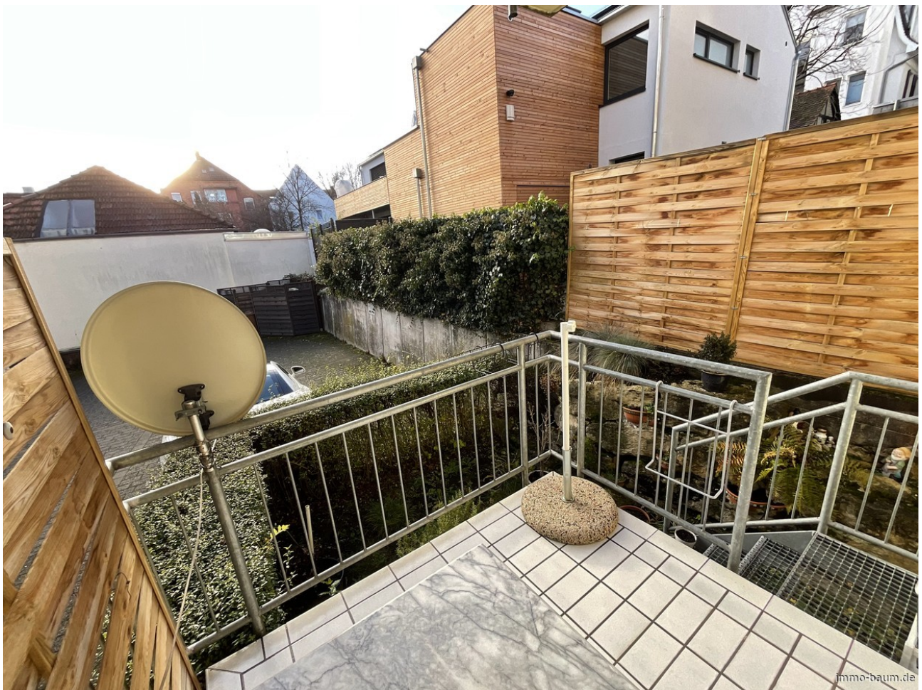
Blick vom Gartenbalkon in den Hinterhof