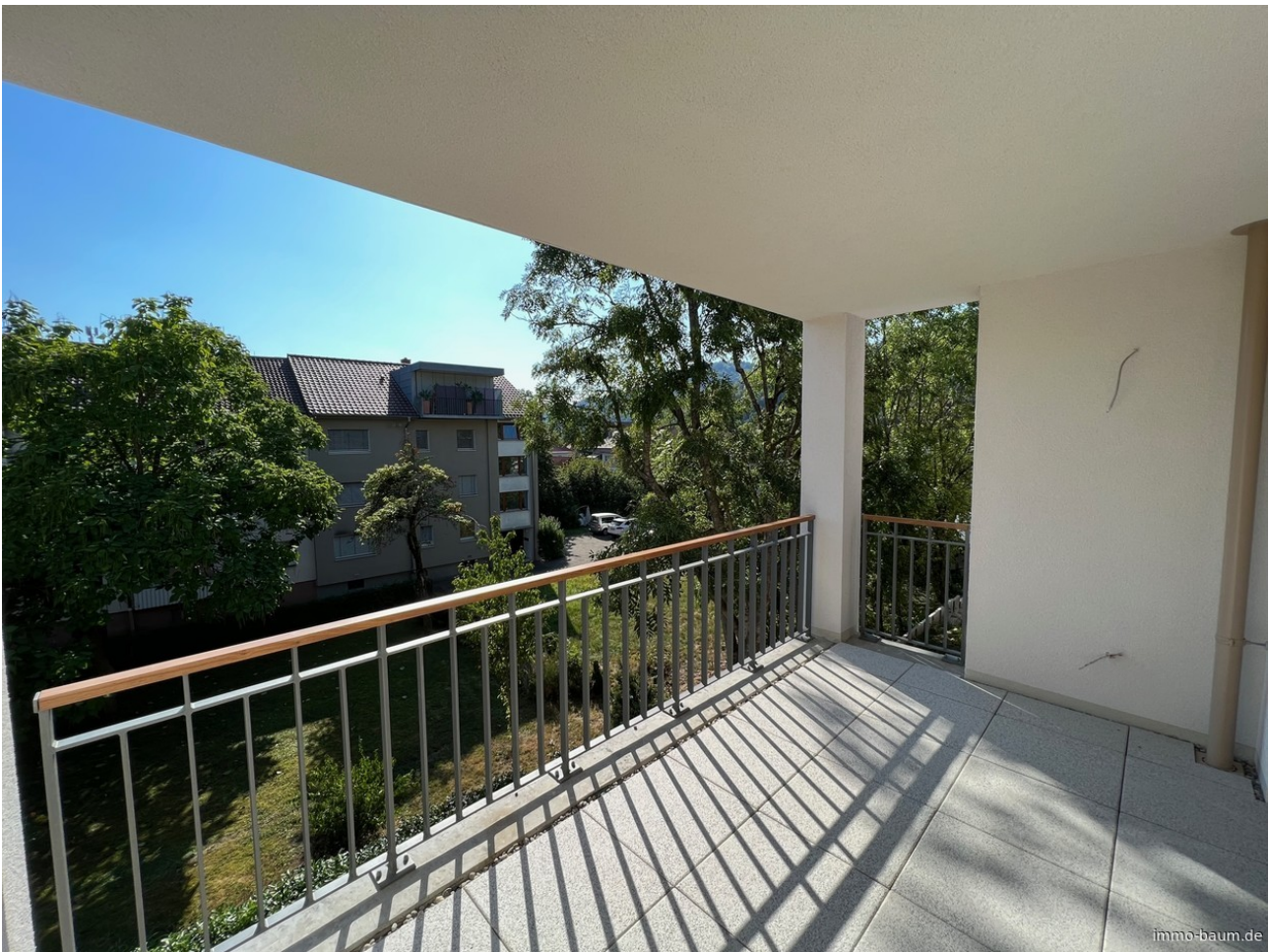
Blick vom Balkon